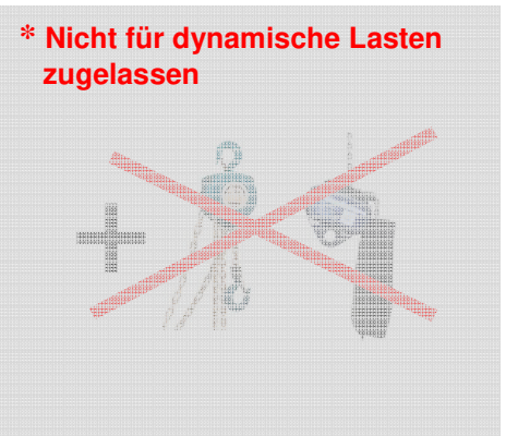
Kurzgliedrige Ketten (DIN EN 818-4)